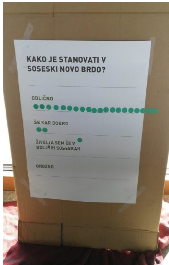
Slika 2: Rezultati kratke ankete.

Rezultati so pokazali, da se večini zdi odlično .