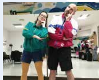
KUD Ljud (SLO): KAR SMO (BILI) (35') gledališko-plesna intervencija