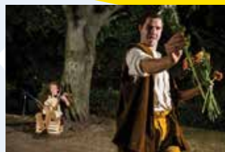
Camerata Crostata (SLO): CVETLIČNA RAPSODIJA (25') ulično gledališče