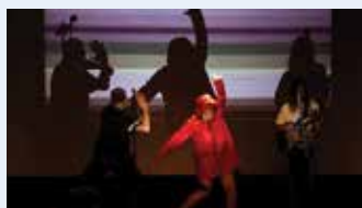
Sign Dance Collective & Transmitter Performance (VB): MEDPROSTORI (50') inkluzivno gledališče