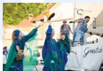
Gledališče Ane Monro (SLO): ZADNI ULUV (35') interaktivna ekološka predstava