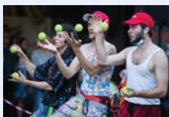
Mismo Nismo (SLO): ŽONGLERSKI KONCERT (35') eksperimentalni cirkus