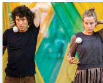
UnderTree (SLO): IZRUVANI (25') sodobni cirkus