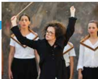
Gledališki pevski zbor (SLO): UPS! (25') glasbena intervencija