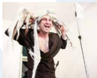
KUD Ljud (SLO): KAKO JE NASTAL SVET (30') otroška predstava