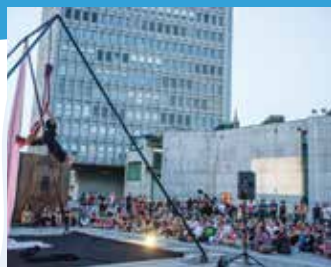
Aerial cirkus (SLO): MIR OR (25') akrobatska plesna predstava