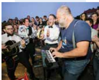
Trio Šardone (SLO): ALA KART (30') interaktivna glasbena animacija