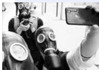
DES_KONEKTAR (ŠPA): SPOMINI (35') interaktivni pohodni eksperiment