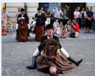
Les Goulus (FRA): KONJENIKI (30') ulično gledališče