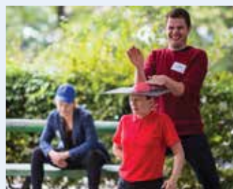
Društvo Impro (SLO): ULIČNI IMPRO KVIZ (25') improvizacijska predstava