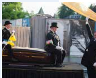
KD Priden možic (SLO): POČIVAJTE V MIRU (35') ulično gledališče