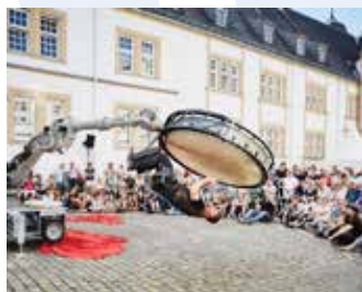
Ulik Robotik (NEM): BOG BOBNA (15') robotski šov