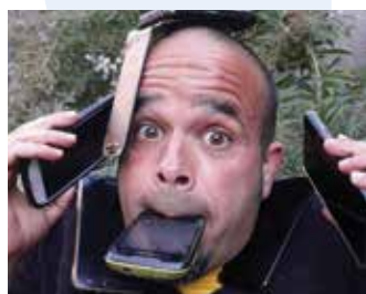
Fadunito (ŠPA): NE-MOBILNO (40') otroška klovnaža