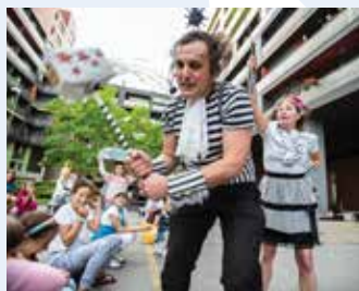
Čupakabra (SLO): KUFR BAND (25') glasbeni cirkus