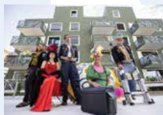
Gledališče Ane Monro (SLO): CIRKUS KORONA (30') сосedsko gledališče